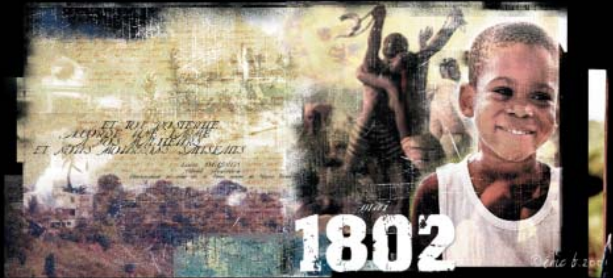
Quelques toiles 2000 - 2003