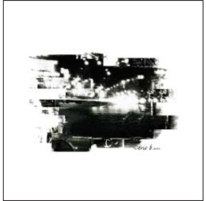
Quelques toiles 1997 - 2003