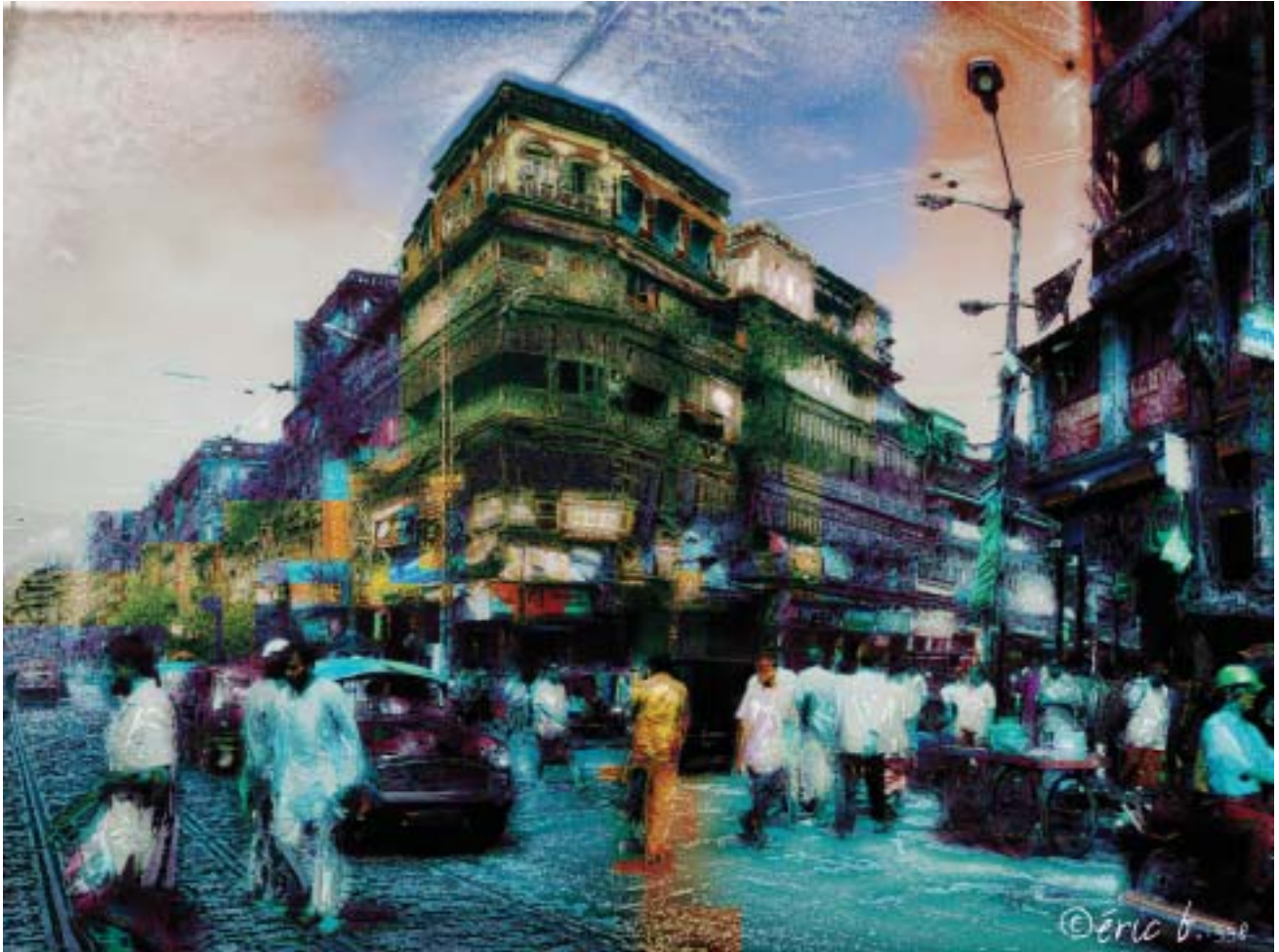
Quelques toiles exposés en 2002